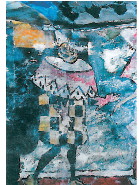
Fresko „Caro“ von Hans Holtorf im Erdmann-Krenek-Holtorf-Türmchen Langballigau